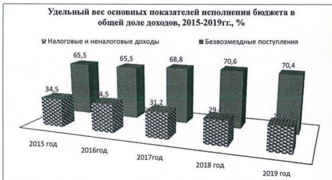
Рис.1. Удельный вес основных показателей исполнения бюджета в общей доле доходов, 2015-2019 гг., %

На рисунке 1 показана динамика удельного веса основных показателей исполнения бюджета в общей доле доходов за 2015-2019 годы. Наибольшую часть поступлений в бюджет составляет группа безвозмездных поступлений, их доля составляет в 2018 году 70,6%.